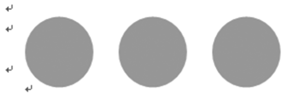
图 06Ç 含有危险力量的工程和装置的国际特别记号

È U I K! C U 6*>î Ó ü ^ # , @Ý$ Ä í &” ; C ¬ £ p v É @Ý$ E Ä*U- \ ±±ï "x æ" 6* ¬ £ =Ø@Ñ ±±} Æc = É