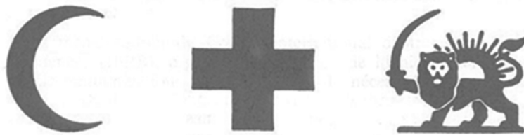
图 %Ç白底红色的特殊标志

- È'! . 4 } a Â3ï7ÿ~ Á 6&"ò âE/ €] T È É » n „ È Ý 5 ; ( ; WK`+±• 'ã , 4A3Ó1 æÄ + %om.g804 g ó É 1 È U I K! C U6*>î Ó ü ^ # , @Ý$ Ä Í &" ; C ñ £ p v , @Ý$ E Ä*U- \ +±ï "x æ" 6* ñ £ =Ø@ØX+±} Æc = É