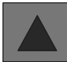
图 1 Ç 橙色底蓝色三角形

0Yn Á Ž Ç * Kr"! . @Ý$ - È Y@ÛÇ “ 0Yš n š Ž0Y k m>ñÇ+±!>K_ç ...+± * Kr"! . @Ý$ \ †7ÿÂ: 7ÿ0vDæ6 >ÿ• É.g 80@Ý$ >î + ‹ É 1 È ; ' @Û }- ~ - É: 7ÿ6 >ÿ• J}J£ U I C6ï0 C C=• 7 , 6 >ÿ• Â*U†7ÿ I C6ï0 C C=• “ }1 ~ 6 >ÿ• +±- W - ,! > 7 “ }6 ~ 6 >ÿ• +±( , - >ÿF* : ? ÷ †7ÿÂ+±Dæ È 6 È * Kr"! . @Ý$ Á 6&” ò âE/€ J T È É"! . @Ý$ Á j 6* , .g U L• 7 C U û j 6* G+±æ> 1 j 6*E +±C .è F*6*>î ÷+± I 7 ÉK' h0Î € m! .g+± ÆC , !>K_ç ...Á j 6* a /¬ α 6 * Kr"! . @Ý$ +±j , 1 =• : É U I K! C U 6*>î Ó ü ^ # , @Ý$ Ä Í &” ; C ¬ £ p v “ @Ý$ E Ä*U- \ +±İ "x æ" m ¬ £ =Ø @Ñ +±} Æc = É